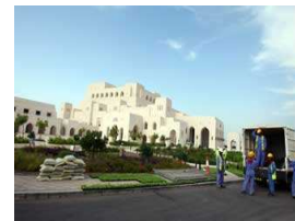
السلطان قابوس يفتتح أول دار أوبرا خليجية مزيد