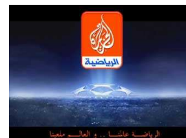
قناة الجزيرة تسعى لانتزاع حقوق نقل مباريات الدوري الانكليزي الممتاز لكرة القدم من "سكاي الرياضية"