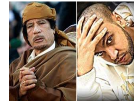
مطرب جزائري ينتقد نوار ليبيا ويصدر أغنية "تحية القذافي"