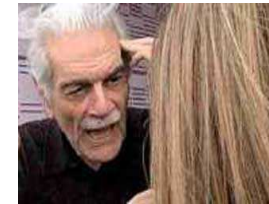
عمر الشريف يصفع معجبة في مهرجان تريبيكا للأفلام بالدوحة