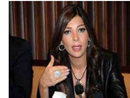
الفنانة السورية أصالة تتراجع عن أغنيتها ضد الرئيس بشار الأسد بعد ان اكتشفت انها لا تكرهه