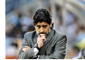
وفاة والدة مارادونا بعد تعرضها لأزمة قلبية