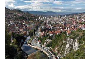
سراييفو تستعيد مشاعر مدينة متعددة الثقافات