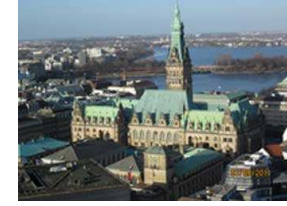
حي هافن سيتي في هامبورج مقصد جديد للسائحين