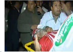
الوداد البيضاء المغربي يتت تورط الأمن التونسي في ضرب جماهيره